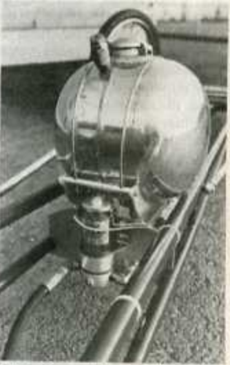
Polttoainetankki on jalkapallon kokoinen, mutta kiiltävämpi. Dragsterin kulutus on neljä litraa kolmella kilometrillä.

raavan kilpailun sekunnit ja se, miten ajoaikaa voitaisiin nitistää vieläkin lyhyemmäksi.