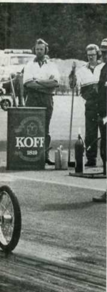
lupailuihin oikeuttavaan superlisens-

keissä suosiossa lajin vanhojen pioneerien keskuudessa ja iäkkäitä, vuosikymmentenkaisia upeita laitteita katselee mielikseen tositoimissa mahtavien burnout-savujen kera.